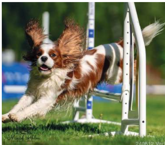
SE VCH, NO BSCH, RLD N, NW 1, AGD 1 Pick-Me-Up Joseph Bonaparte (Vincent)

De hundar som deltar i BPH beskrivs vid samma moment och med samma protokoll. Det ger en objektiv bild av dem. Vad som sedan är typiska, och önskade, beteenden hos respektive ras är en sak för rasentusiaster med uppfödare och ras- och specialklubb i spetsen att fundera och diskutera kring. En sak vet vi: hundar är – och ska vara – olika!