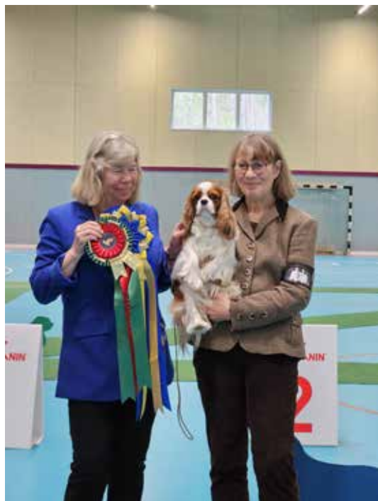
Cert tik dag 2

Noen utovervridde poter bak som hadde trange og rørete bevegelser bakfra. Ellers hadde jeg ønsket på endel Cavalierer runde og større øyne for å få det milde og vennlige uttrykket de skal ha, men de fleste hadde mørke øyne (kanskje