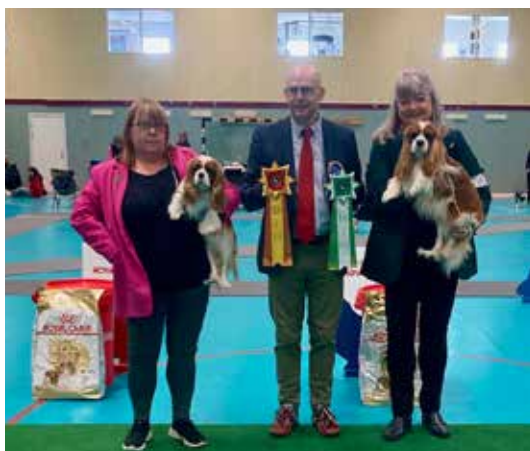
BIR & BIM dag 1