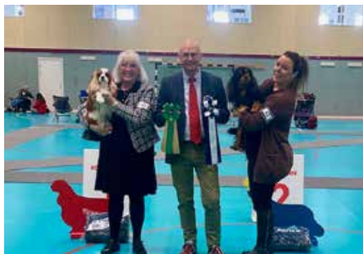
BIR & BIM veteran dag 1