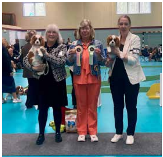
BIR & BIM valp dag 1