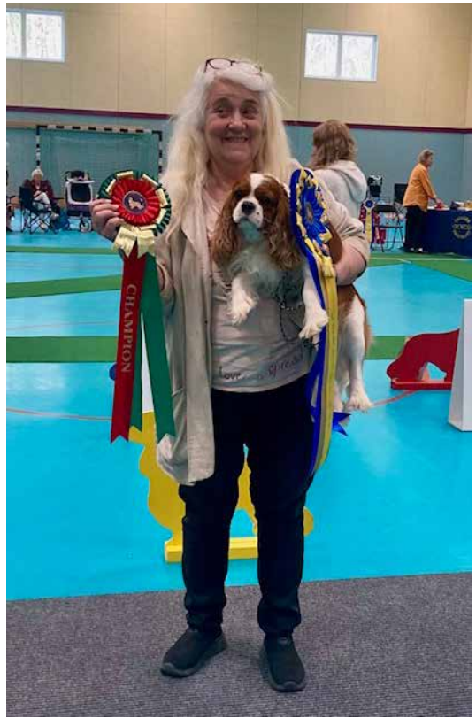
Cert hane dag 1