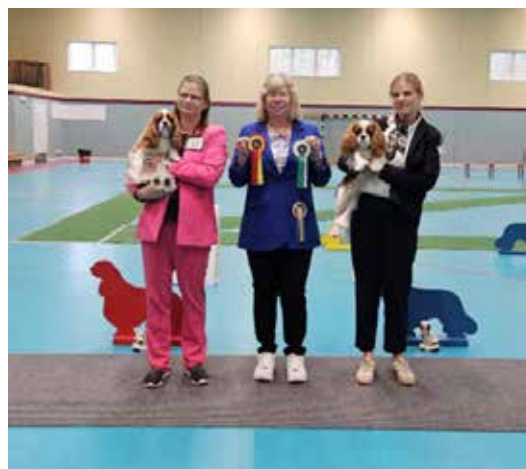
BIR & BIM junior dag 2