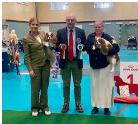
BIR & BIM junior dag 1