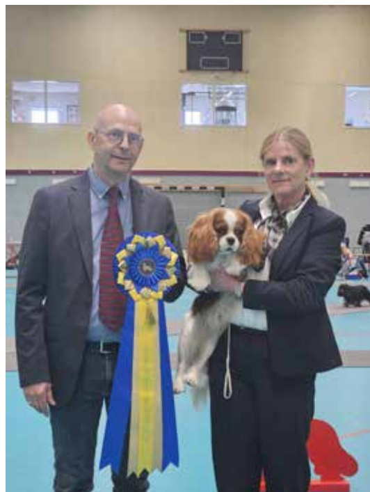
Cert hane dag 2