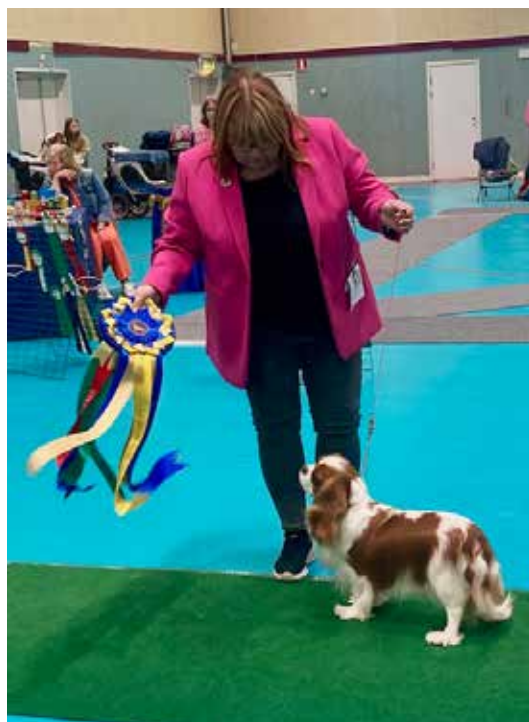
Cert tik dag 1