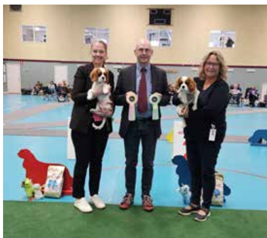
BIR & BIM valp dag 2