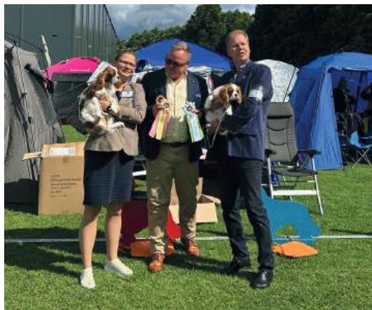
BIR valp MERLS Finest Beautiful Thing BIM valp Petit Maxim Arthur