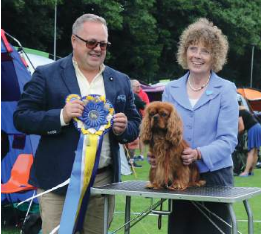
Dagens hundar som fick certifikat var: Amberton's Charles Darwin Rose