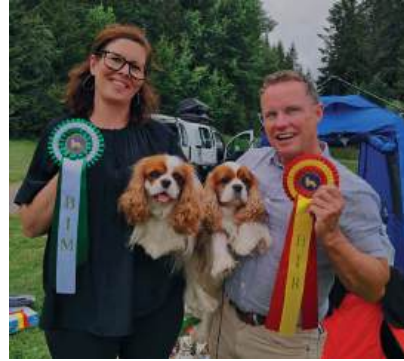
BIR Emperix Snowfall och BIM Emperix Philora