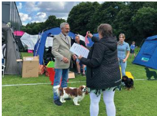
BIM junior Festivitas Crash-Boom-Bang