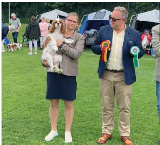
BIR junior MERLS Finest Angel By The Wings