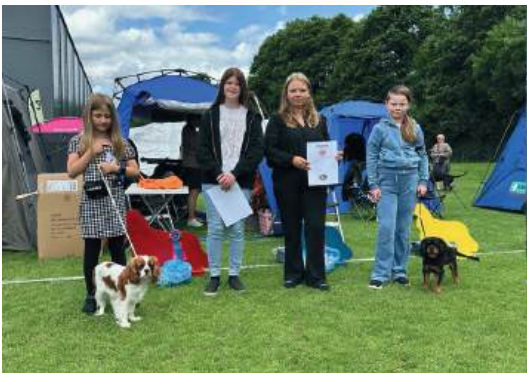
Barn med hund.