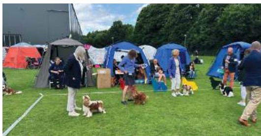
Bästa hane 1. Toftas Tom Tom 2. Amberton's Charles Darwin Rose 3. Lovepearls You Light Up My Life 4. Cavanzas Going For Prince