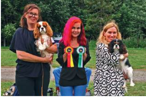
JUNIOR BIR Emperix Skydancer o BIM Cavanzas Julianza