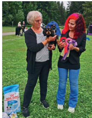
BIR VALP Cavamirs Minerva McGonagall