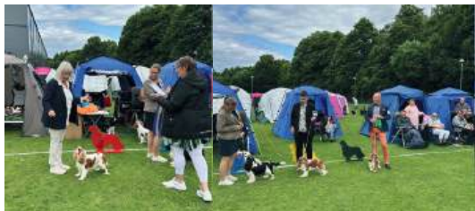
Bästa tik 1. Toftas Unique Blanche 2. Zinkitens Viktualia 3. Cavanzas I Stole The Show 4. Cavanzas London Eye