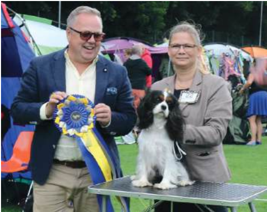
och Zinkitens Viktualia